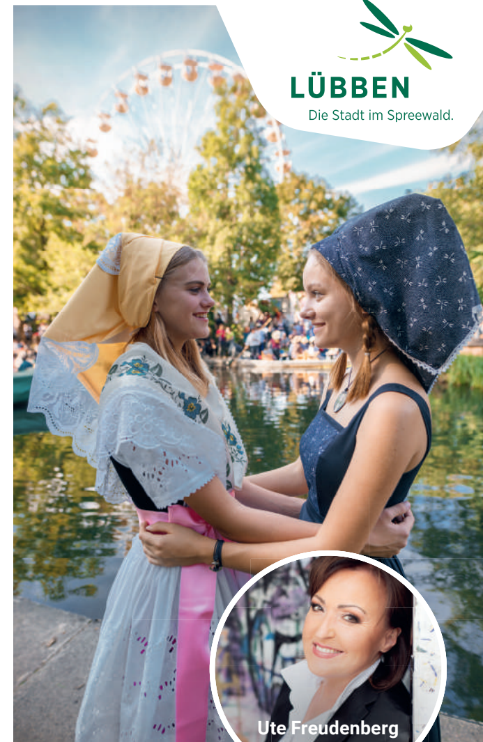
Ute Freudenberg & Band